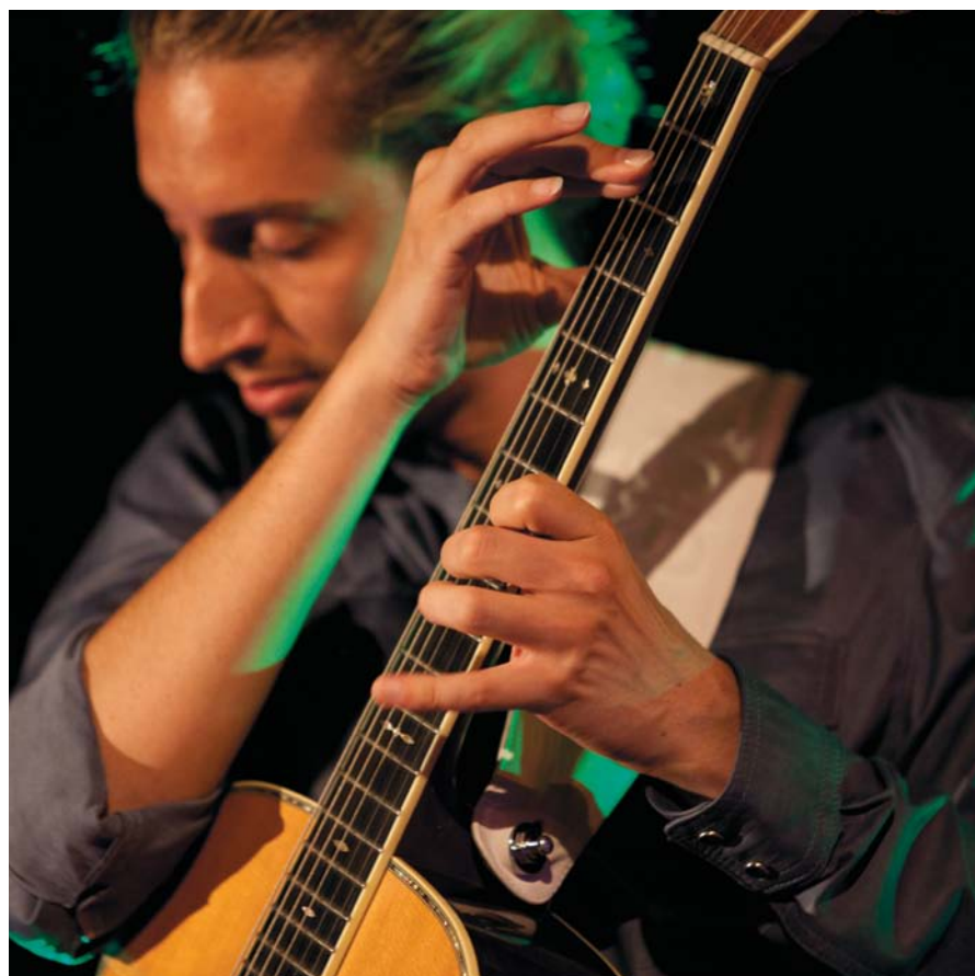
Fotografie del calendario 2011

Il racconto si apre con la copertina del calendario dedicata ad un giovane artista amico di Romagna Est, ospite del Convegno Tra Centanni - 2010, Gio-